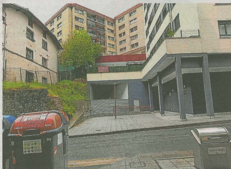
Esta semana comenzarán con el forjado en el ascensor de Zerukoa. A. L.

Por otra parte, el Ayuntamiento incluyó también en estas ayudas el ascensor público de Zerukoa, que tuvo que ser concedido en procedimiento negociado,