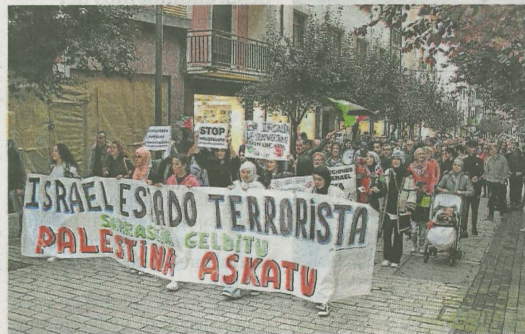
Las manifestaciones se organizan en Ermua desde hace siete meses. A. L.

El colectivo local que organiza la manifestación para mañana aclara que «este genocidio no se podría llevar a cabo sin la complicidad de la comunidad internacional». Es por ello que la Iniciativa Ermua con Palestina cree que «es imprescindible que la sociedad continúe saliendo a la calle para exigir a nuestros mandatarios que reaccionen de una vez, y se decidan a romper las relaciones comerciales y militares con Israel, aplicando sanciones de manera urgente, tal y como ha reclamado la relatora de la ONU para Palestina».