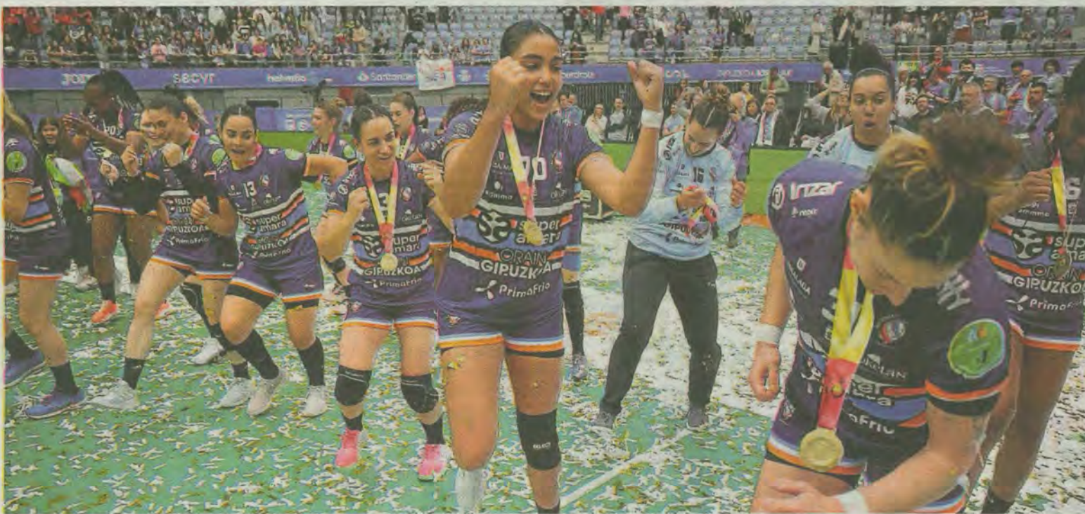
Las jugadoras del Bera Bera bailan con sus medallas de campeonas tras ganar la final ayer en Illunbe ante el Aula Valladolid.

Fuera de lo deportivo, no me gustaría olvidarme de todas esas personas que, con su granito de arena, han ayudado a que la de este 2024 haya sido la mejor Copa de todas.