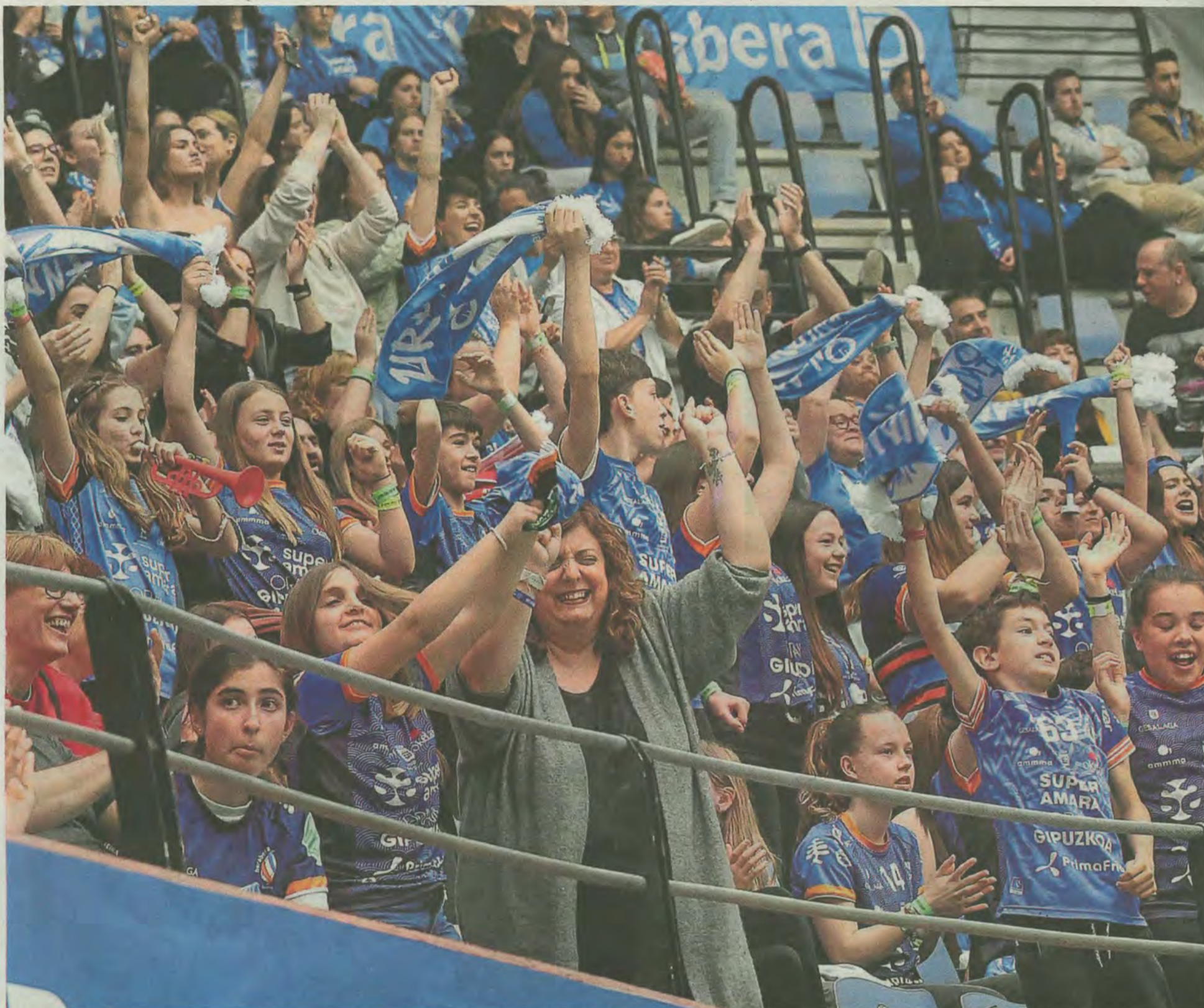
Illunbe se llenó ayer hasta la bandera con 4.238 aficionados que ayudaron al Super Amara Bera Bera con su apoyo a ganar la octava Copa de su historia.