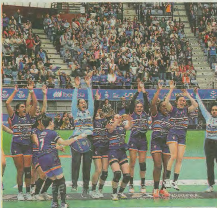
Había ganas de celebración tras el pitido final. La comunión entre equipo y afición fue total. J. M. LÓPEZ

No será hasta que termine la liga regular cuando las diferentes instituciones realicen el tradicional recibimiento al equipo ganador de la Copa. Las pupilas de Imanol Álvarez descansan hoy y mañana, y será a partir del miércoles cuando comiencen a preparar el segundo partido de la semifinal del playoff contra el Málaga, que se disputará en tierras andaluzas. En el primer encuentro, celebrado hace ya unos días, las guipuzcoanas consiguieron una trabajada victoria. La fiesta de la Copa deberá esperar a que termine la liga regular. El trabajo es lo primero.