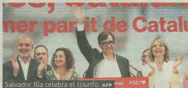
Salvador Illa celebra el triunfo.

Tras la victoria histórica de Illa, el pacto con más visos de prosperar es el de los socialistas con Esquerra y Comuns, frente a una alternativa de bloqueo que llevaría de nuevo a las urnas