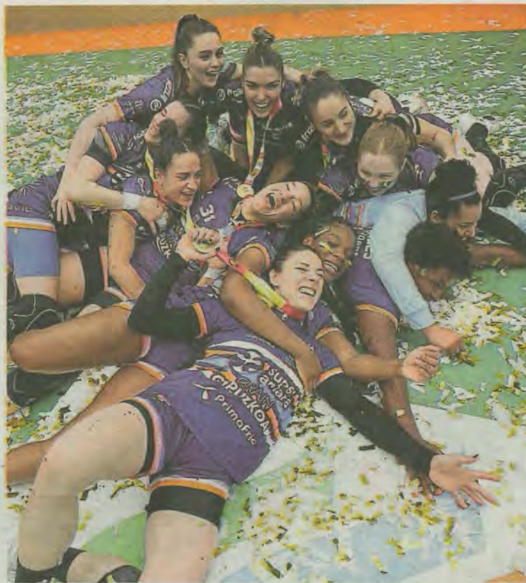
La fiesta tras el pitido final fue total sobre el 40x20 de Illunbe. Confeti, música y celebración.