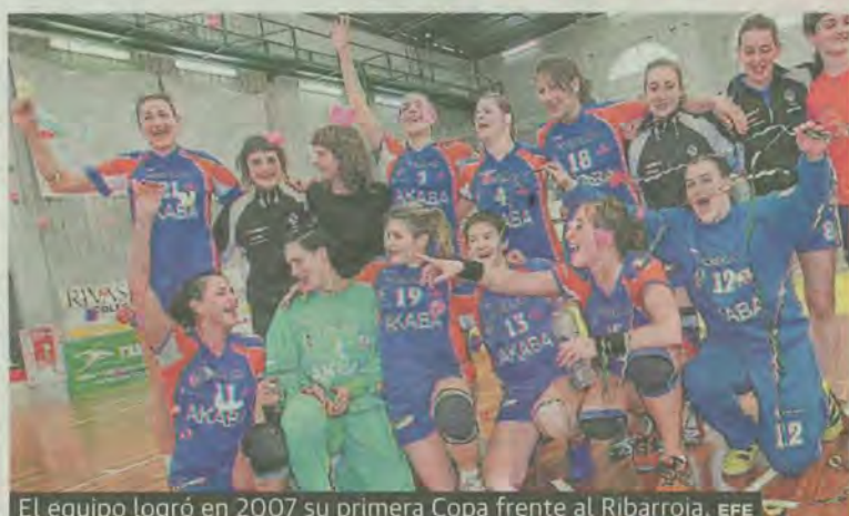
El equipo logró en 2007 su primera Copa frente al Ribarroja.

Gijón. La escuadra de Imanol Álvarez no dio opción al Gijón (22-35) y se adjudicó su octavo título a falta de tres jornadas.