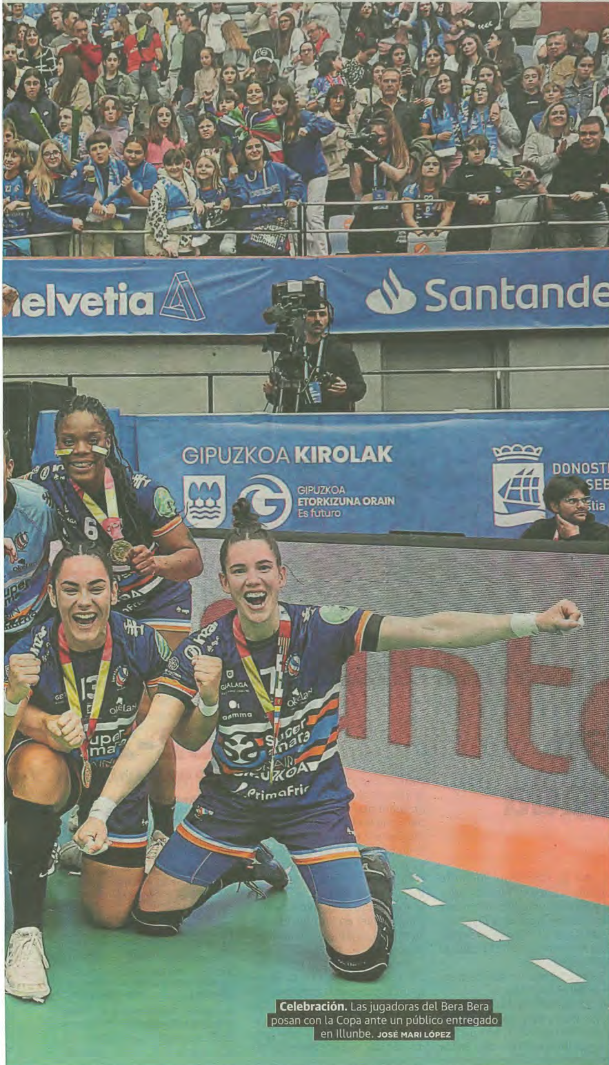
Celebración. Las jugadoras del Bera Bera posan con la Copa ante un público entregado en Illunbe. JOSÉ MARI LÓPEZ

Altuna, semifinalista del Manomanista tras batir a Darío 22-19 P60