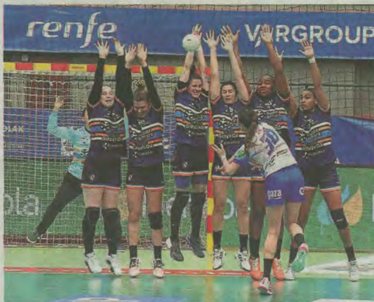
Lanzamiento de falta del Aula con el reloj a cero antes del descanso.