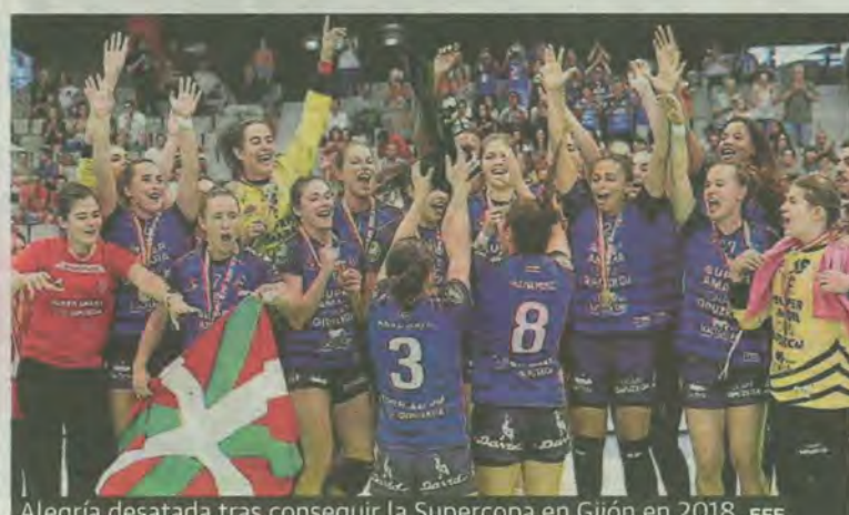
Alegría desatada tras conseguir la Supercopa en Gijón en 2018.