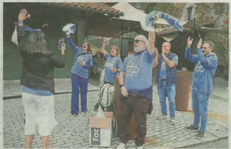
Los aficionados celebraron antes y después del partido el gran éxito del Bera Bera.