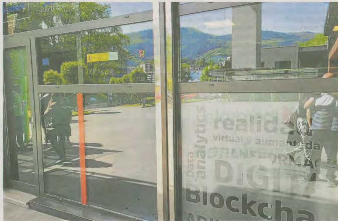
La oficina Acelera Pyme está en la planta de entrada del edificio Izarra Centre. A.L.

Las empresas, organizaciones o personas que acuden a este ser-