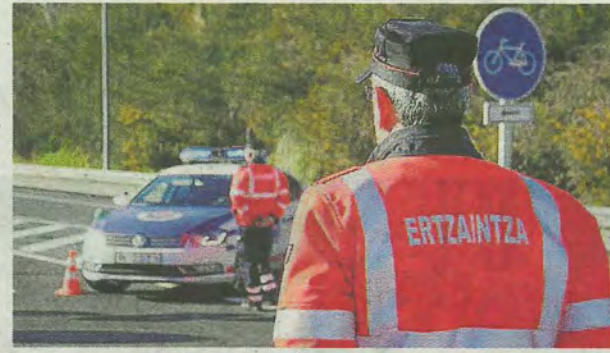
Es el segundo motorista fallecido en carreteras vizcainas en 2024.

das el pasado 17 de febrero en la que el conductor de la moto perdió la vida en un accidente registrado en la A-8 a la altura de Muskiz dirección Cantabria. - Aitor García