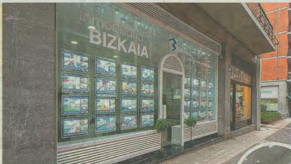
El proceso comienza con un encuentro donde se evalúan las necesidades del cliente.

Desde su fundación, Inmobiliaria Bizkaia ha enfocado sus esfuerzos en acompañar a sus clientes en cada etapa del proceso inmobiliario, desde la primera consulta hasta el cierre final de la operación. El proceso comienza con un encuentro personalizado, donde se evalúan las necesidades y preferencias del cliente, seguido por una visita al inmueble y una valoración y tasación gratuita del