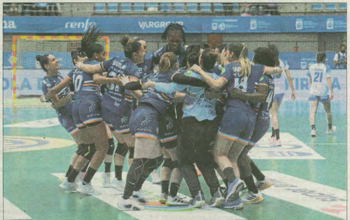
Bera Berako jokariak, elkar helduta, biribilean, garaipena ospatzen.