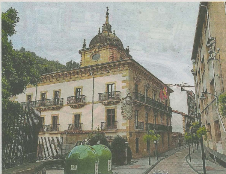
Los consistorios se autoevalúan para conseguir el sello europeo ELoGE.