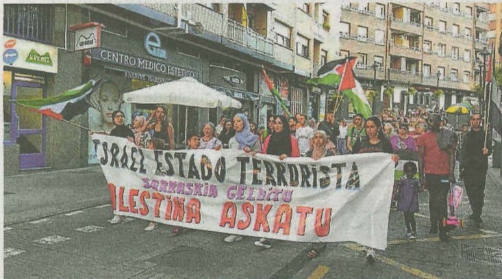
Imagen de la manifestación que se desarrolló en Ermua. I. E. P.

Como consecuencia, la Iniciativa Ermua con Palestina cree que «es imprescindible que la sociedad continúe saliendo a la calle para exigir a nuestros mandatarios que reaccionen de una vez, y se decidan a romper las relaciones comerciales y militares con Israel, aplicando sanciones de manera urgente, tal y como ha reclamado la relatora de la ONU para Palestina».