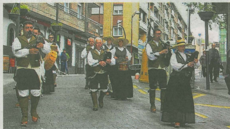
Las gaitas sonarán durante estos días por las calles ermuaras. A. L.

El domingo, los grupos Txindurri, Coros y Danzas de Extremadura y el grupo Os Galaicos actuarán en la plaza a las 12.00 horas. El Vino de Honor para colaboradores se celebrará hasta las 13.30 horas en la sede y la actuación de la orquesta Estelamar, se ofrecerá de 13.00 a 14.00 horas, en la plaza. Os Galaicos actuará de nuevo a las 14.00 horas en la calle San Isidro.