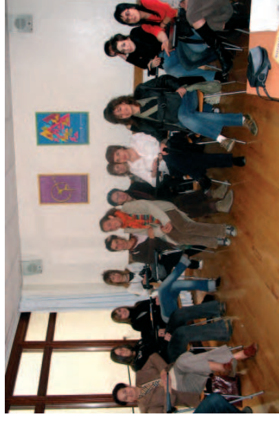
Taller "mujeres como agentes de la historia: memoria, vida y resistencia" Jabekuntza Eskola. Ermua. 2007ko martxoa

Nik historia handietan zein eguneroko bizitzan protagonista ziren emakumeak bilatu eta haien izenak aldarrikatu nahi nituen.