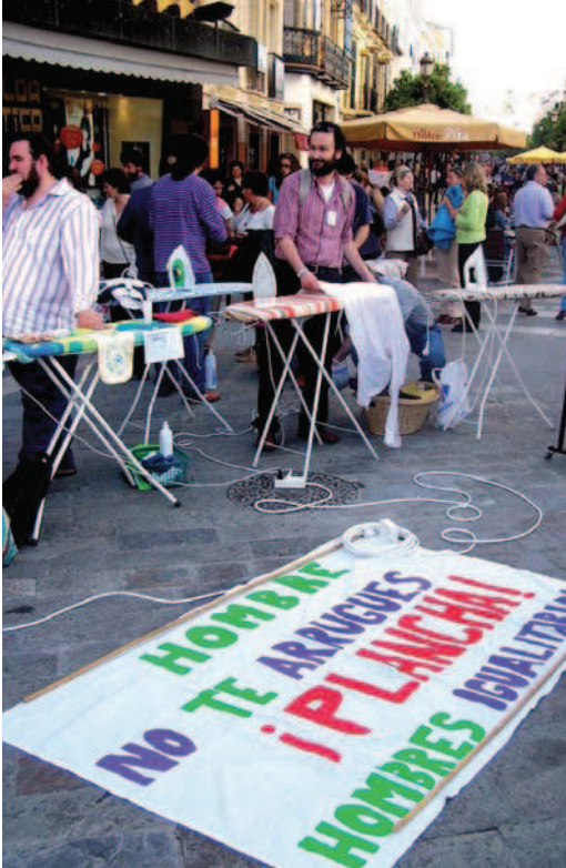
> Actividad realizada por Hombres Igualitarios de Jerez de la Frontera en 2005.