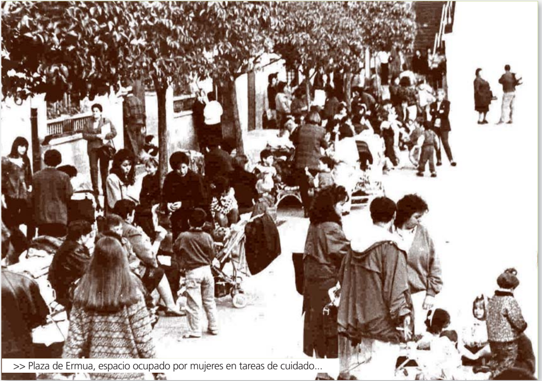
>> Plaza de Ermua, espacio ocupado por mujeres en tareas de cuidado...

moria histórica de la ciudadanía con una huella material, que ayude a no olvidar y a repudiar todas las expresiones de la violencia sexista.