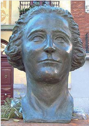
>> Busto de Clara Campoamor en Madrid